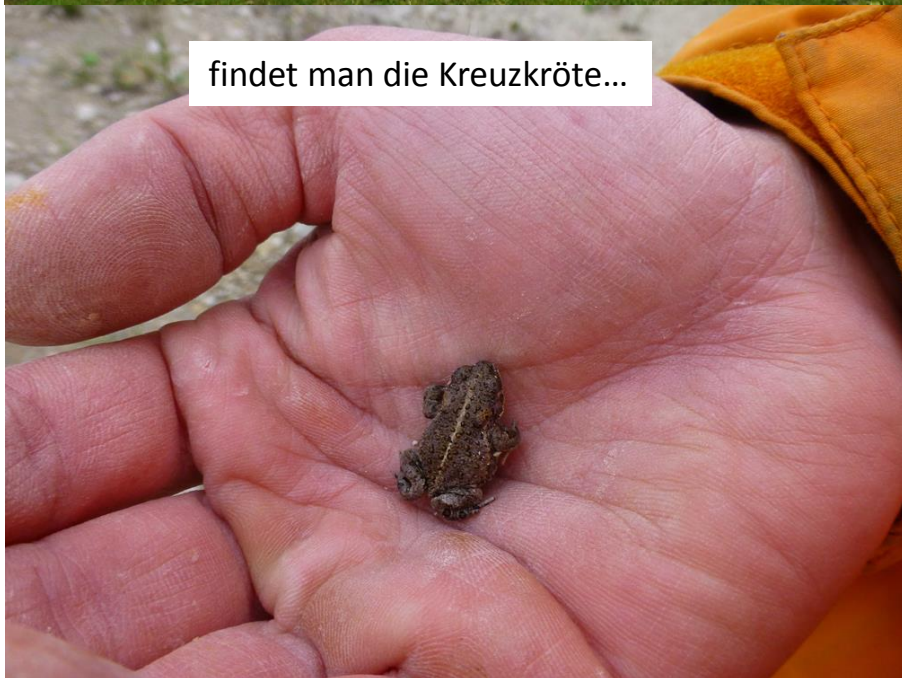
findet man die Kreuzkröte...