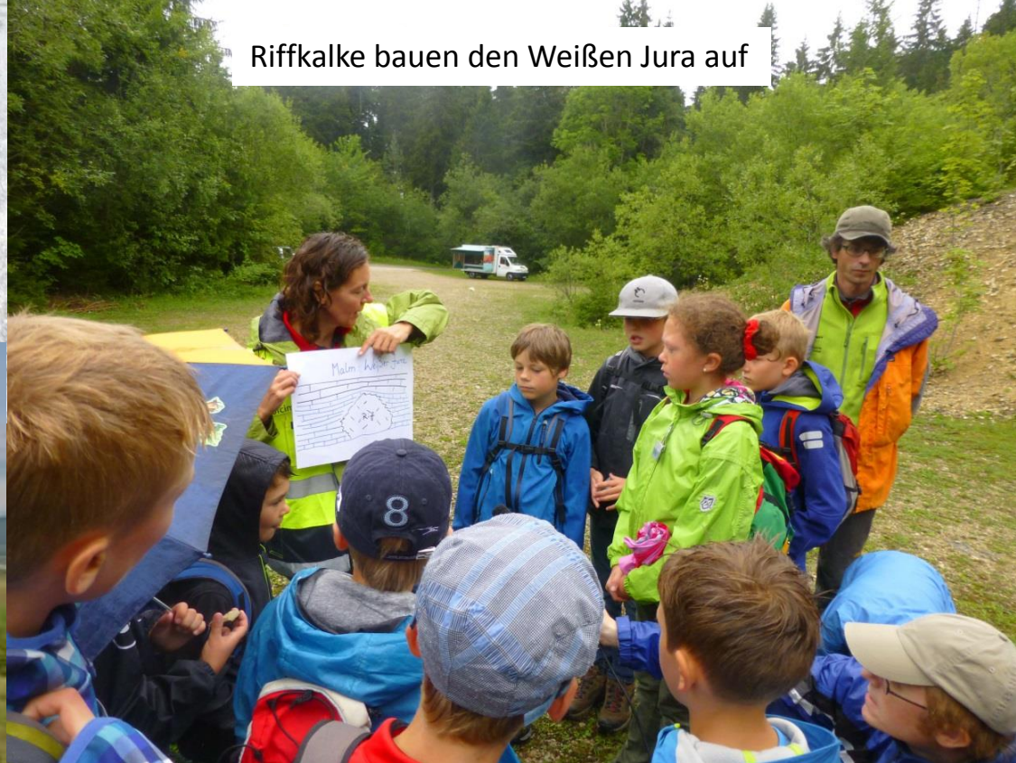
Riffkalke bauen den Weißen Jura auf