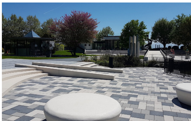
Abb. 1 Anlage mit unterschiedlichen Betonbauteilen, teilweise auch eingefärbt

Betonbauteile, die während der Herstellung intensiver Sonneneinstrahlung und/oder starkem Wind ausgesetzt sind, müssen unmittelbar nach dem Ausschalen vor dem Austrocknen geschützt werden.