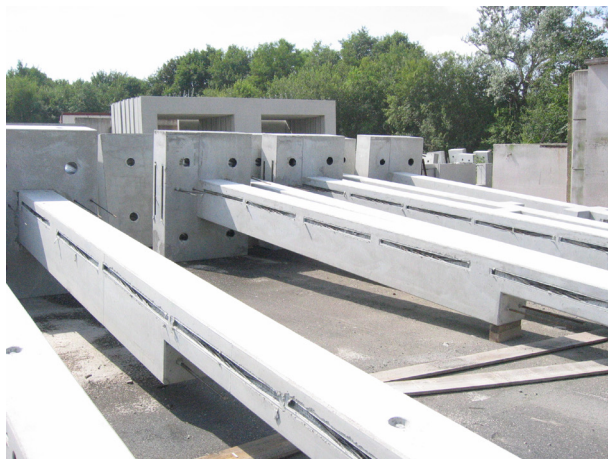
Abb. 1 Fertigteilstützen für den Industriehallenbau

Betonbauteile, die während der Herstellung intensiver Sonneneinstrahlung und/oder starkem Wind ausgesetzt sind, müssen unmittelbar nach dem Ausschalen vor dem Austrocknen geschützt werden.