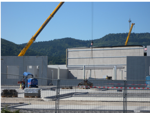
Abb. 1 Aufstellen von Fertigteilwänden auf der Baustelle

Betonbauteile, die während der Herstellung intensiver Sonneneinstrahlung und/oder starkem Wind ausgesetzt sind, müssen unmittelbar nach dem Ausschalen vor dem Austrocknen geschützt werden.