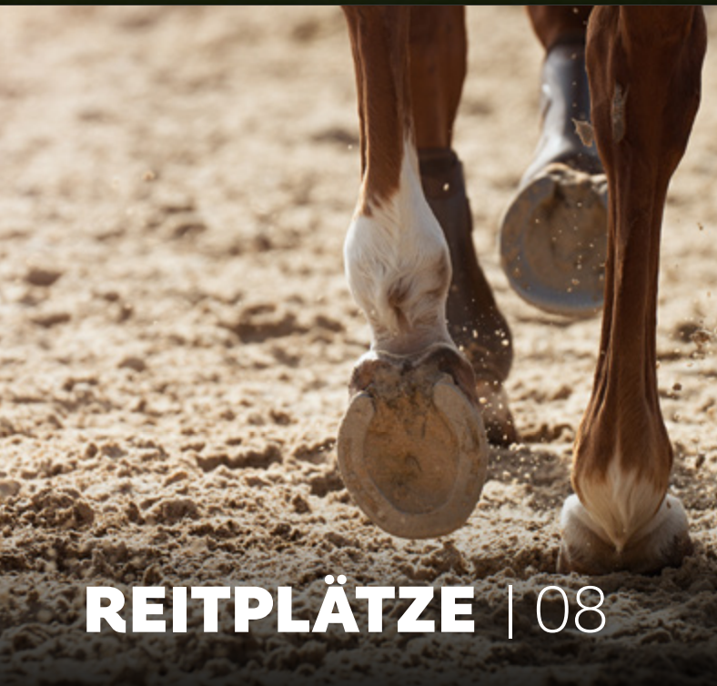
REITPLÄTZE | 08