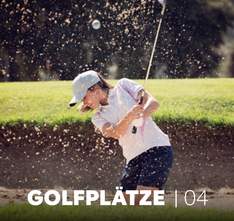
GOLFPLÄTZE | 04