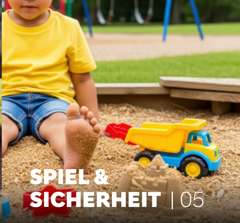
SPIEL & SICHERHEIT | 05