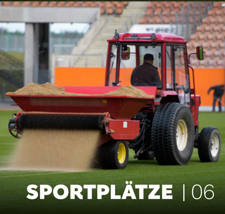
SPORTPLÄTZE | 06