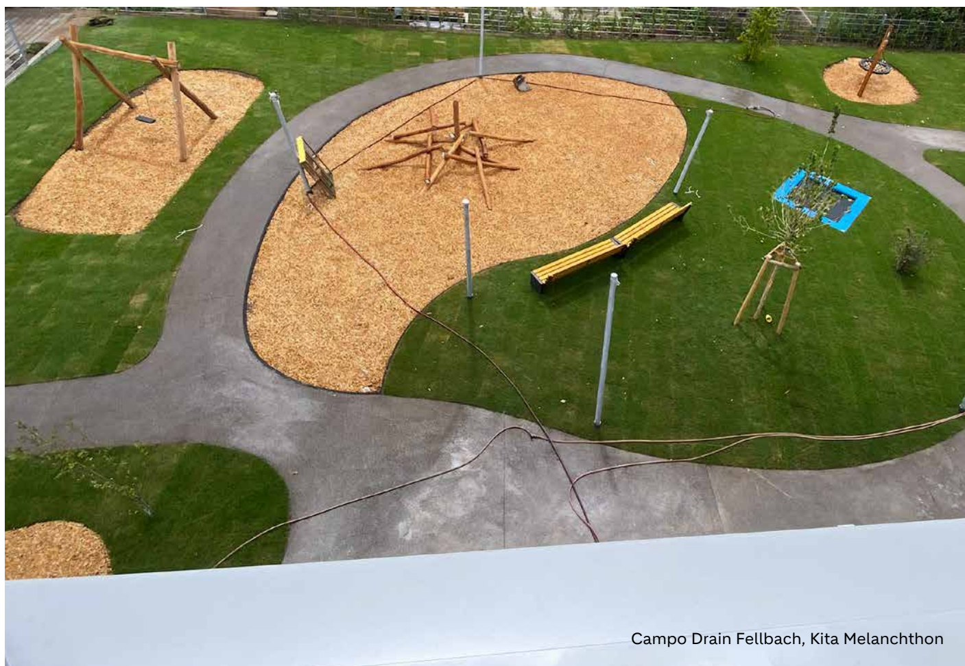
Campo Drain Fellbach, Kita Melanchthon