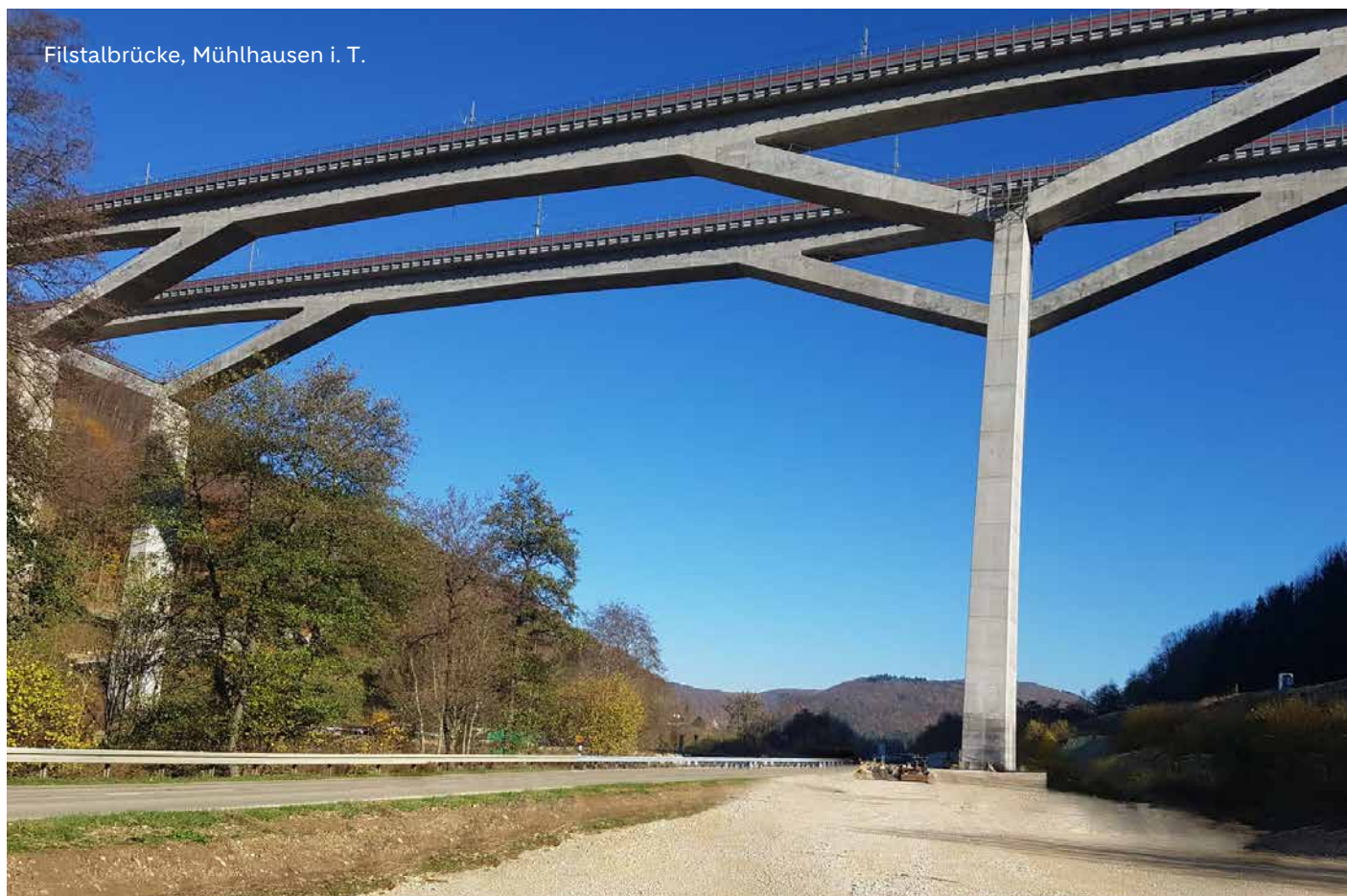
Filstalbrücke, Mühlhausen i. T.