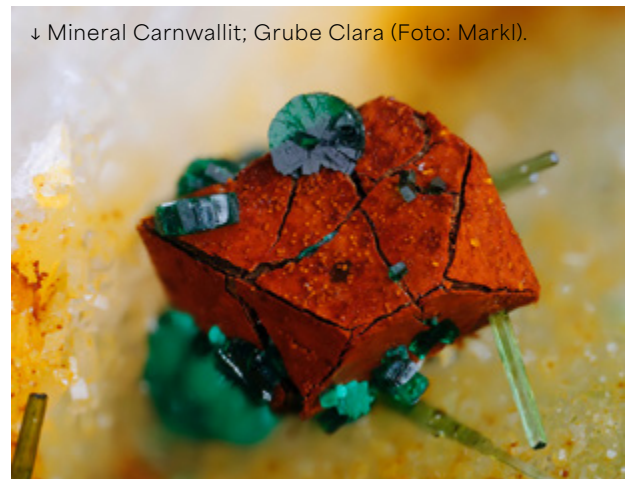
↓ Mineral Carnwallit; Grube Clara.

und Schmetterlinge vorstellen, die in baden-württembergischen Abbaubetrieben vorkommen und wird erläutern, warum Abbaubetriebe für manche Arten von Tieren regelrechte Oasen sind.